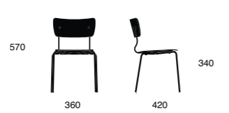
ARENA 022 BB