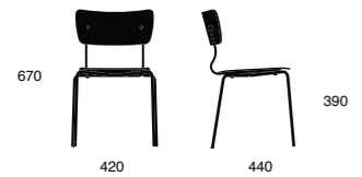
ARENA 022 JR