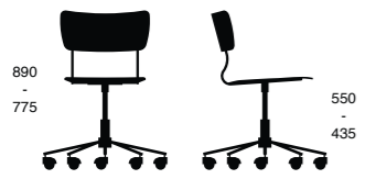
ARENA 022 S